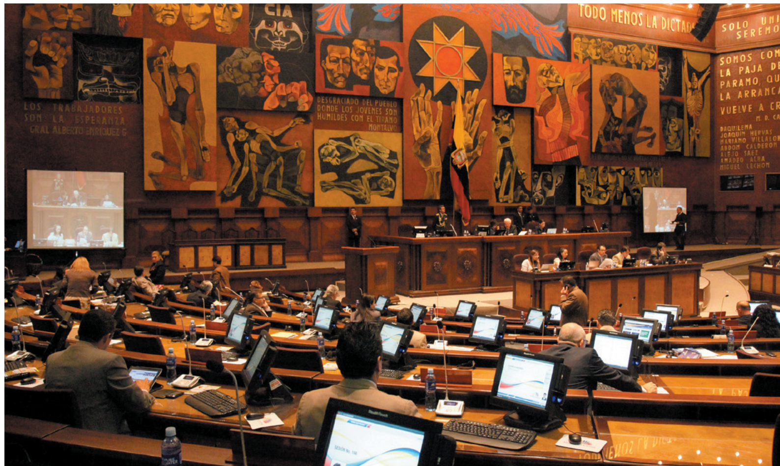
assemblée constituante nationale d'Équateur en 2007

Pour les Quechua, la Pachamama désigne la Terre Mère. Son accession au titre de sujet de droit dans la nouvelle constitution de l'Équateur en 2008, puis dans la législation de la Bolivie l'année suivante, donne une assise légale aux conceptions indigènes œuvrant à la préservation de la nature et à la reconnaissance de sa dimension sacrée. Ce geste cosmopolitique augmente la scène politique d'un nouvel acteur avec lequel et pour lequel gouverner.